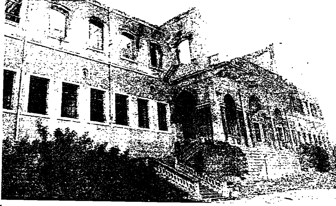
مخزل مكاتب الجريدة في السراي

كما كانت تعتبرها في السابق نافذة من تاريخ النشر في الجريدة الرسمية. لكن الاثر على باب رئاسة الحكومة قد يصلح بالنسبة الى المراسيم ذات الطابع الاداري، لكنها لا تصلح للمراسيم التشريعية التي تتضمن قوانين وعقوبات، كالمرسوم الذي صدر بصدد قرش الرقابة على الصحف. وتعليقا، قال احد القضاة، انني كتلت في احد ايامي احدى الصحف، هل ادعه في مكتبي واذهب الى السراي الجديدة، لآقرأ نص القانون الذي سلكه على اساسه؟ من الادارات الحكومية التي عطلتها الاحداث، الجريدة الرسمية ... التي تطبق للقوانين والمراسيم الحكومية قوة النفاذ، والصفحة التشريعية لازمة، وبدونها لا يصح قانون نافذ ولا مرسوم صالحا للتطبيق. على ان الحكومة، وبصورة استثنائية عرضتها للظروف، ابتكرت طريقة جديدة لنشر المراسيم التي تصدرها مؤخرا، وهي نشر هذه القوانين على باب رئاسة الحكومة، واعتبرت هذه المراسيم نافذة من تاريخ نطقها على باب رئاسة الحكومة.